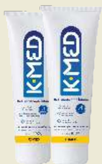
K-med Gel 100g