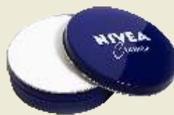
Creme Hidratante Nivea Lata 56g