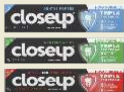
Creme Dental Closeup Tripla Proteção Menta, Menta Americana ou Hortelã 70g