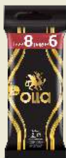
Preservativos Olla Leve 8 pague 6