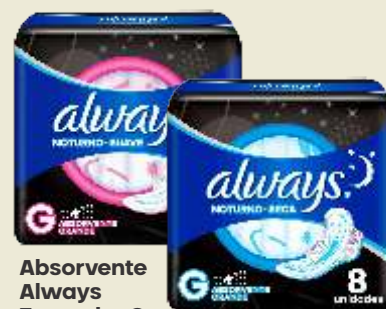
Absorvente Always Tamanho G Noturno Seca ou Suave c/ abas 8 unidades