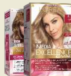
Tintura Imédia Nuances Diversos Tons *Exceto Sem Amônia/Blonde Supreme