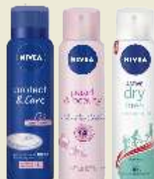
Desodorante Nivea Aerosol Feminino ou Masculino 150mL *Exceto Clinical e Deomilk