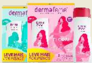
Sabonete Líquido Íntimo Dermafeme Fragrâncias 2x200mL