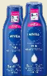
Loção Hidratante Nivea Milk Hidratação Profunda 400ml