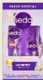
Kit Seda Shampoo 300mL Condicionador 190mL Diversos