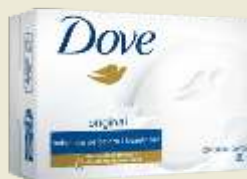
Sabonete Dove Original 90g