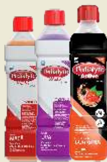
Pedialyte Max ou Active 500ml Sabores