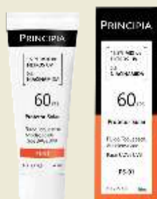
Protetor Solar Principia FPS 60 Toque Seco PS-01 40mL