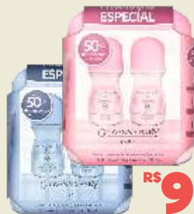
Kit Desodorante Giovanna Baby Rollon Blue ou Classic c/ 2 unidades 50mL